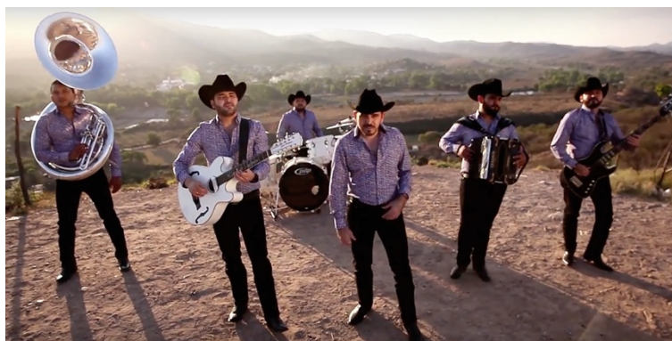
Figura 2: Norteño-Banda. (Captura de pantalla de Código FN - Humilde De Abolengo, 2016)

En el relevo generacional, los jóvenes imprimen un nuevo estilo al momento de ejecutar sus instrumentos. Comparados con corridos más antiguos, los que interpretan los jóvenes son más rápidos rítmicamente. En su mayoría, los jóvenes integrantes de conjuntos norteños se iniciaron en la música interpretando otros géneros como rock, ska o punk, músicas que exigen una rápida ejecución de instrumentos. Algunos han estudiado en escuelas de música y tienen conocimientos para interpretar diversos instrumentos. Al preguntar sobre la forma en la que hacen música, reconocían que es difícil desprenderse totalmente del conocimiento que tienen de los otros géneros. Para ellos, tener conocimiento de la música y experiencia en otros géneros musicales les permite realizar arreglos musicales más complicados y ser más creativos en el plano musical. Según Adolfo Valenzuela, precursor del Movimiento Alterado, la tradición corridística ha evolucionado: “[...] musicalmente, rítmicamente; ha evolucionado en cuestiones de instrumentos; y la temática también”. 15 Estos cambios, constituyen “la música de los jóvenes, la moda”. En continuidad, explica: