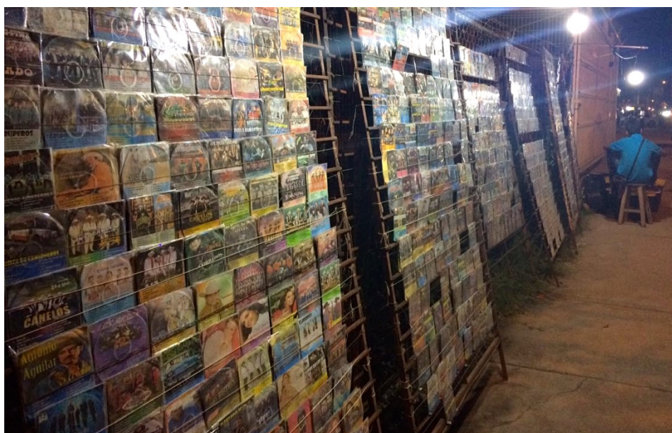
Figura 3: Punto de venta.

En Culiacán, otra forma importante de circulación y consumo de narcocorridos es el top manta . 28 En estos puestos, predominan los discos de música norteña, de banda y narcocorridos. Los puntos de venta es posible encontrarlos en lugares estratégicos donde hay constante flujo de personas: el centro de Culiacán, mercados, cerca de estacionamientos, paradas de autobuses, gasolineras, expendios de cerveza, taquerías y afuera de pequeños supermercados 24 horas OXXO.