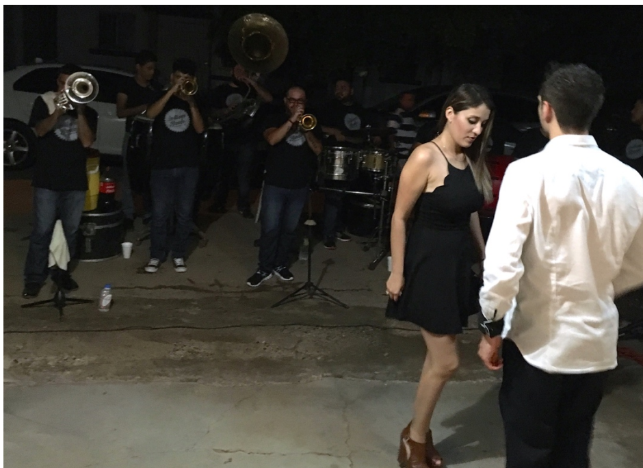
Figura 4: Banda-Baile en fiesta privada.

Los lugares donde los músicos prestan sus servicios son variados. Pueden ser contratados para tocar en una casa dentro de la ciudad, en un salón de fiestas, en un centro de baile, en la calle, o en poblados y propiedades a las afueras de la ciudad. Se puede dar el caso de que sean lugares desconocidos para los músicos. Los músicos no son contratados exclusivamente por personas relacionadas con lo ilícito. Prestar sus servicios, es una forma de darse a conocer y de garantizar trabajo e ingresos para el grupo: “nosotros tocamos en fiestas privadas [...] con la misma gente que nosotros tocábamos nos recomendaban [...] y así hemos ido avanzando en este negocio” (EMC G.S. 09).