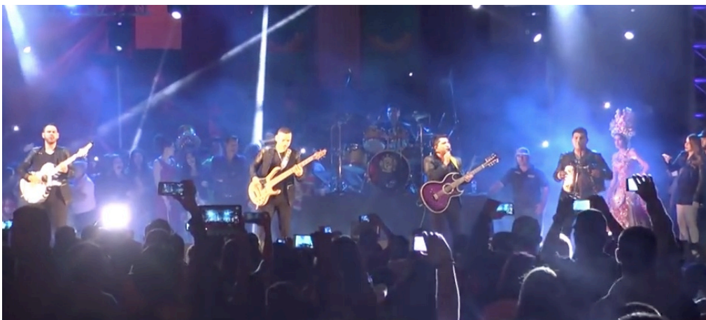
Figura 5: Concierto. (Captura de pantalla de akayalla: Enigma Norteño – El Karma @ Carnaval Angostura, 2015)

Al hablar con los jóvenes sobre conciertos o eventos, me explicaron que por lo regular son organizados y patrocinados por cervecerías. En el caso de los conciertos, traen a agrupaciones más reconocidas para generar espectáculo. Para jóvenes de trayectoria reciente es arriesgado iniciar una gira artística sin el respaldo de una empresa que responda por ellos. Es mejor ganar en proporción a las entradas vendidas por evento. En este sentido, los músicos aprovechan la mercadotecnia desplegada por la industria cervecera para interpretar y promocionar su música e incrementar así su popularidad. Por otra parte, la cervecería se sirve de la popularidad de los artistas para incrementar sus ventas y promocionar sus productos. Para los usuarios, es una oportunidad para entrar a un concierto, consumir alcohol y escuchar a sus artistas a un costo accesible.