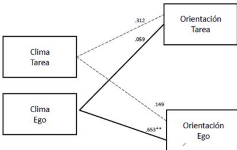
Figura 2. Correlaciones entre Climas Motivacionales y Orientaciones de Meta.